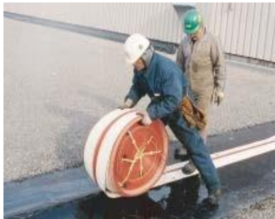
RedLINE 20G instalado en Asfalto Modificado

RedLINE 20G puede soportar una columna de agua de 41 mts (134 pies), mientras mantenga una expansión de 1" (25 mm)